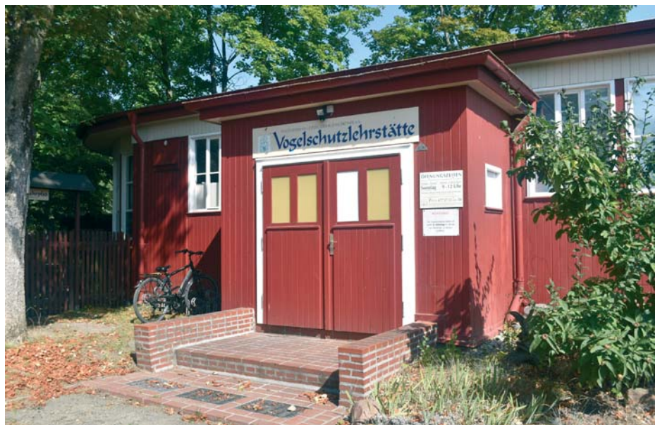
Die Vogelschutzlehrstätte, links geht es zum Vogelhain.

erhalten. Eine kleine Präsentation der Vogelschutzlehrstätte ist seit vielen Jahren fester Bestandteil des Standes der Leipziger Kleingärtner auf den Messen „Haus-Garten-Freizeit“. Allerdings wird sie in der historischen Laube von den Besuchern nur wenig beachtet.