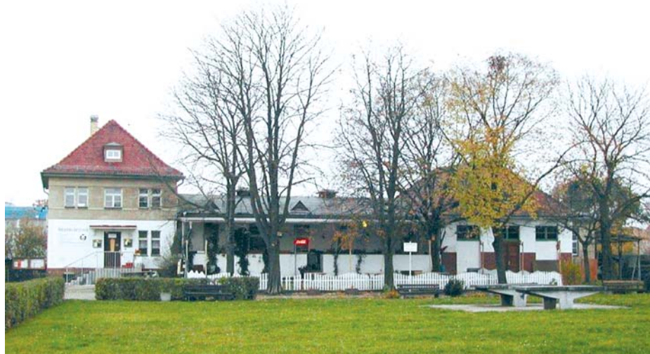
Das „Kulturhaus Eutritzsch“ (KGV „An der Thaerstraße“) ging als Sieger aus der LVZ-Umfrage hervor.

Mit dem hoffentlich sonnigen Herbstmonat Oktober beginnt jetzt auch die Kürbiszeit. Die Kürbisse stammen aus der „Neuen Welt“, sind also Neophyten. Sie gehören zu den ältesten Kulturpflanzen. Durch Samenfunde wurde nachgewiesen, dass in Mittel- und Südamerika bereits vor 10.000 Jahren Kürbisse angebaut wurden. Anfangs wurden nur die Samen verwendet. Erst als es gelang, Arten mit bitterfreien Früchten zu züchten, wurde das ganze Gemüse genutzt. Mehr zum Kürbis und einige Hinweise zu seiner Verwendung finden Sie auf Seite 7 dieser Ausgabe. -ad