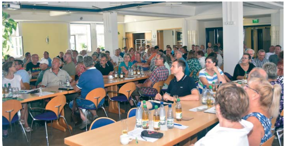
Beachtliche 104 Teilnehmerinnen und Teilnehmer waren trotz des hochsommerlichen Wetters zum Tagesseminar Recht des Stadtverbandes gekommen.

In der Satzung kann aber geregelt werden, wie die Vorstandsmitglieder den Verein gerichtlich und außergerichtlich vertreten. Die Satzung kann auch Bestimmungen zum geschäftsführenden und erweiterten Vorstand enthalten.