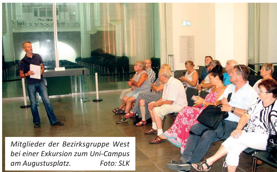
Mitglieder der Bezirksgruppe West bei einer Exkursion zum Uni-Campus am Augustusplatz.

In den Beratungen werden vor allem Hinweise und Beschlüsse des SLK, aber auch eigene festgelegte Themen im Rahmen von Erfahrungsaustauschen behandelt, sowie Termine – z.B. die Durchführung von Kinder- und Sommerfesten – abgestimmt. Damit haben die Vereinsvorsitzenden eine gute Möglichkeit, über ihre Sorgen und Nöte zu sprechen und gegenseitige Hilfe zu organisieren.