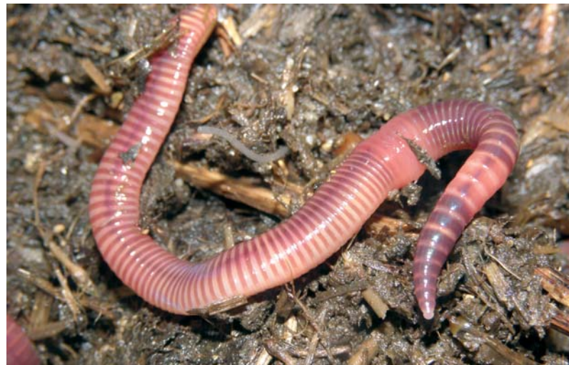
Ein Kompostwurm in seinem Element.

Regenwürmer sind normalerweise in der Nacht aktiv. Sie lockern die Erde auf und wandeln durch ihren Stoffwechsel Gartenabfälle in wertvollen Dünger um. Dabei nehmen sie die oft sauren Stoffe des Bodens auf und neutralisieren diese. Außerdem sorgen die Tiere für eine Durchlüftung und Durchmischung des Bodens und transportieren Nährstoffe von unten nach oben. Je mehr Regenwurmgänge im Beet oder Rasen vorhanden sind, umso weniger Nässe kann sich stauen.