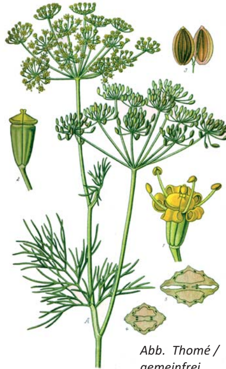
Abb. Thomé / gemeinfrei

Dill ist eine einjährige Pflanze mit kleinen Fiederblättchen. Sie bildet