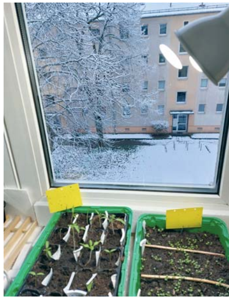
Im Februar oder März geht's los mit der Jungpflanzenanzucht.

im Garten allein aus. Dann müssen wir ggf. regulieren, was zu viel oder am unpassenden Ort ist.