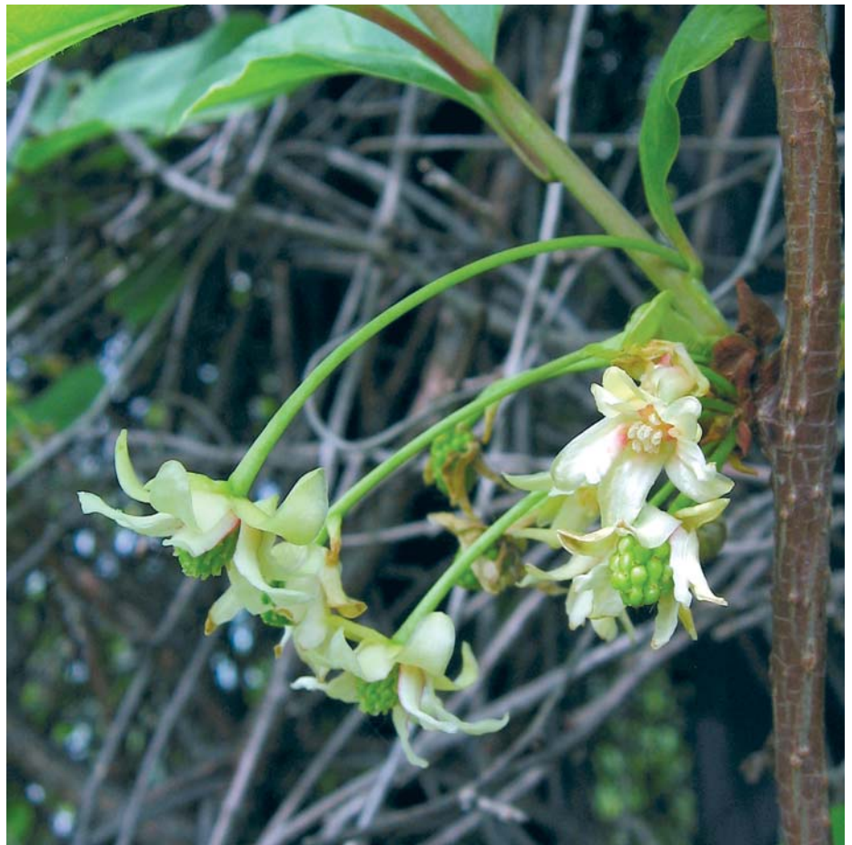
Bei der Chinabeere befinden sich weibliche (oben rechts) und männliche Blüten an ein und derselben Pflanze.

Im ersten Jahr der Pflanzung kann es vorkommen, dass sich nur weibliche oder nur männliche Blüten bilden und die Früchte ausbleiben. Doch im