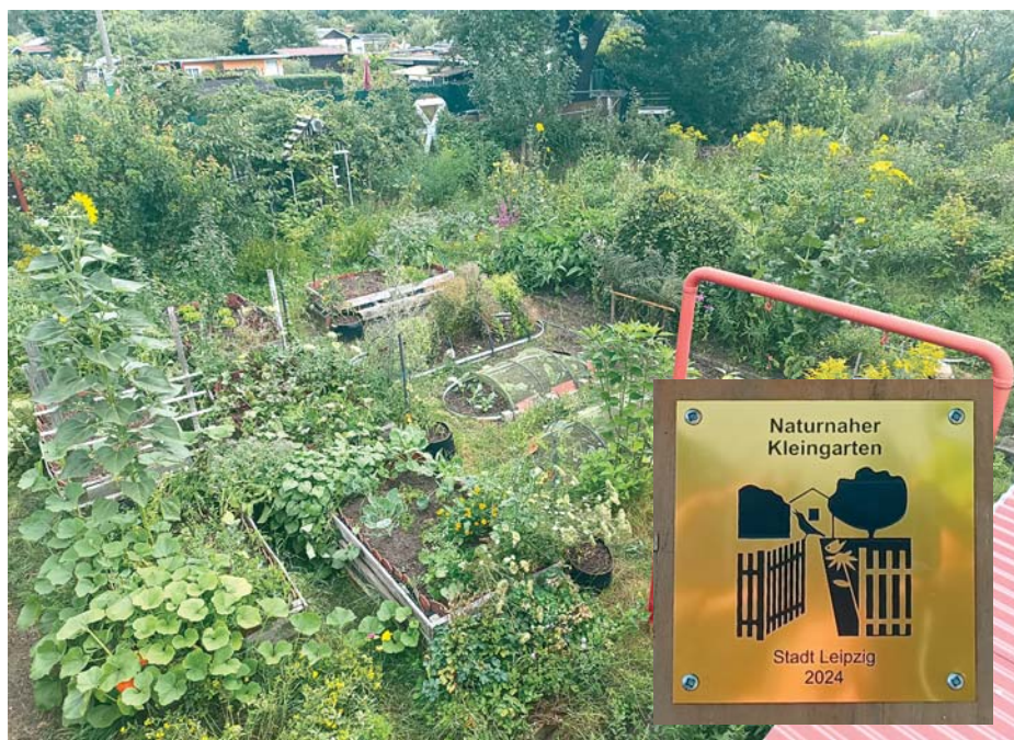
Der preisgekrönte naturnahe Garten und die Ehrenplakette.

Eine bunte Vielfalt aus einheimischen Obst- und Ziergehölzen, Blumen und Gemüse sowie Nützlingen bestimmen das Bild des Gartens. Zum naturnahen Garten gehört auch, der einheimischen Fauna die richtigen Lebensräume (Nischen) zu schaffen. Je vielfältiger der Garten gestaltet wird,