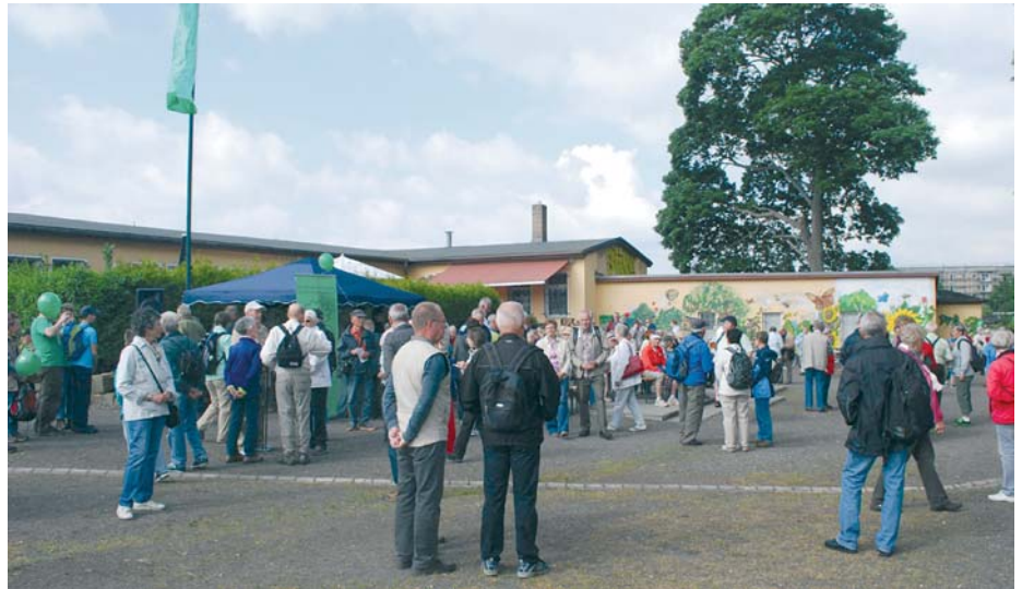
Der KGV war 2017 Start und Ziel der 13. Wanderung durch Leipziger Kleingartenanlagen.

Verein unter dem neuen Namen „Kleingartengruppe Lößnig-Dölitz“ in die damals gültige Struktur des Kleingartenwesens eingeordnet. Solidarität wurde großgeschrieben, die Gartenfreunde halfen einander und schafften wieder Ordnung.