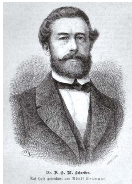
Dr. Moritz Schreber, hier auf einer Zeichnung von 1883.