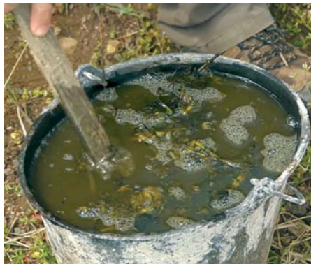
Brennnesseljauche ist für ihren strengen Geruch berüchtigt.

• Brühe: Eine Brühe wird genau wie die beschriebene Jauche angesetzt, Auf 10 l Wasser kommt 1 kg zerkleinertes Pflanzenmaterial. Dieses wird aber nur einen Tag lang eingeweicht