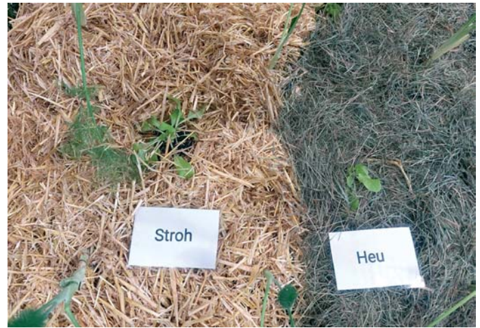
Zur „Haus-Garten-Freizeit“-Messe wurden am Stand der Leipziger Kleingärtner Mulchmaterialien gezeigt.