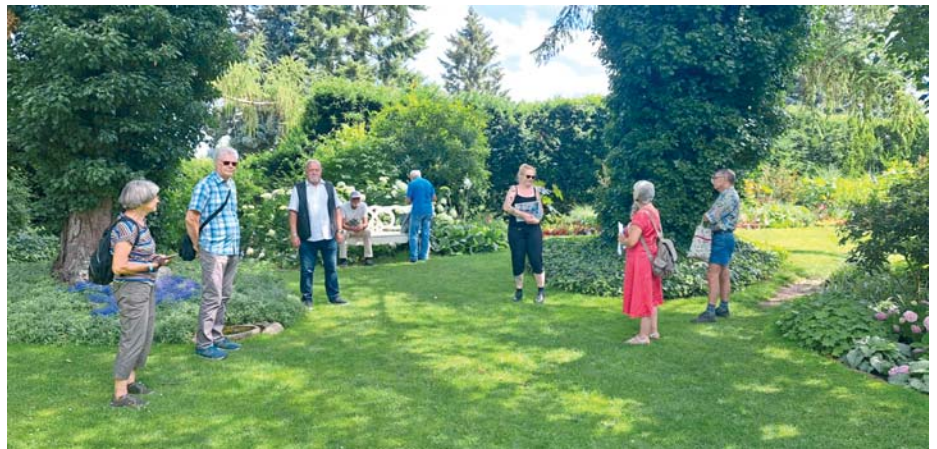
Die GFK-Mitglieder bei der Führung durch die Anlage.