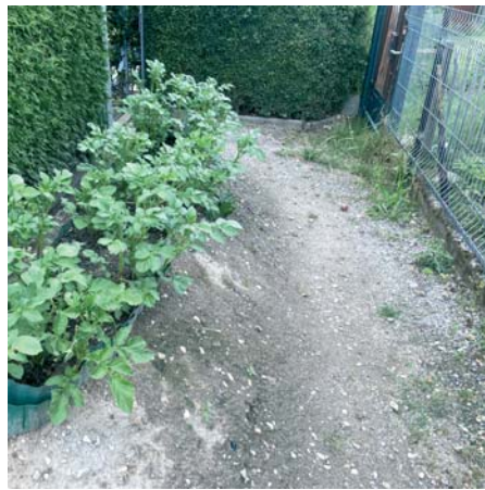
Konnte der Aushub mal nicht gleich abtransportiert werden, wurde er kleingärtnerisch zwischengenutzt.