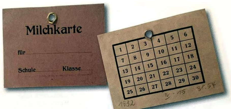
Milchkarte für Schulkinder aus dem Jahr 1932.