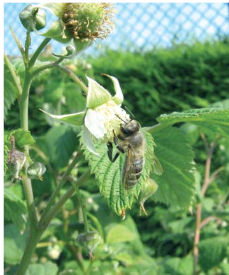
Himbeerblüten sind für Bienen und viele andere Insekten ein „gedeckter Tisch“.

Sorten wie „Schönemann“, „Polka“, „Aroma Queen“, „Tulameen“ und „Malling Promise“ sind als Sommerhimbeeren zu empfehlen, für Herbsthimbeeren hingegen „Fall Gold“, „Glen Clova“ und „Autumn Bliss“.