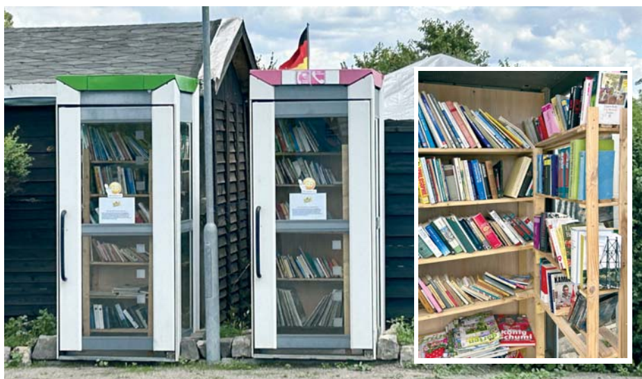
Außen Telefonzelle, innen vereinseigene Bibliothek – die Tauschboxen im Kleingärtnerverein „Kultur“ e.V.

Da es sich um Tauschboxen handelt, ist es erlaubt und ausdrücklich gewünscht, dass die Nutzer dieses Angebotes auch eigene, gut erhaltene Bücher mitbringen und diese in der Box für andere Interessenten hinterlassen.